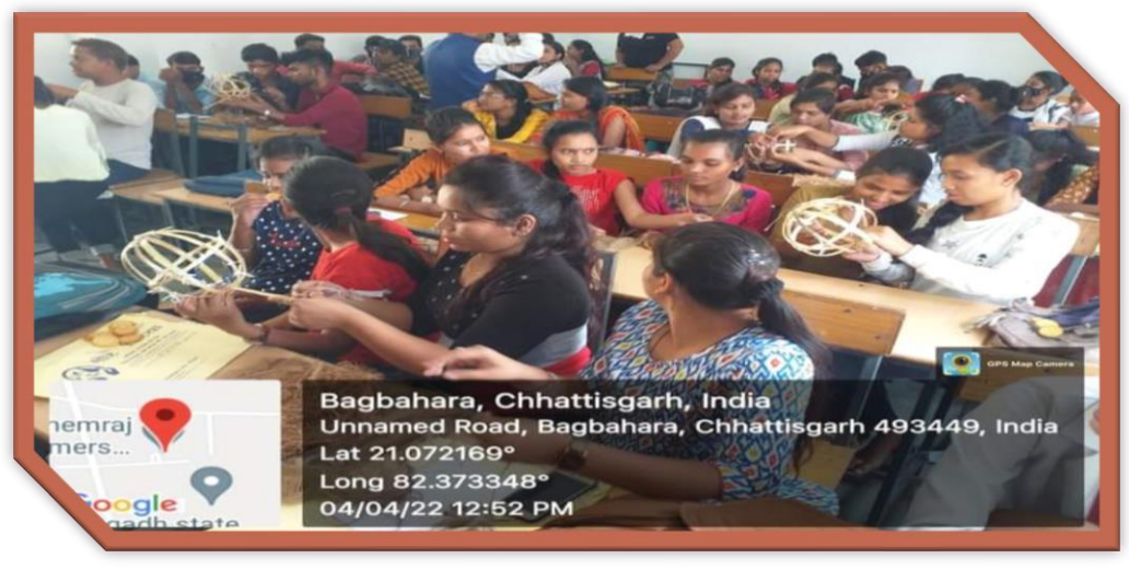
House Sparrow Protection Camp