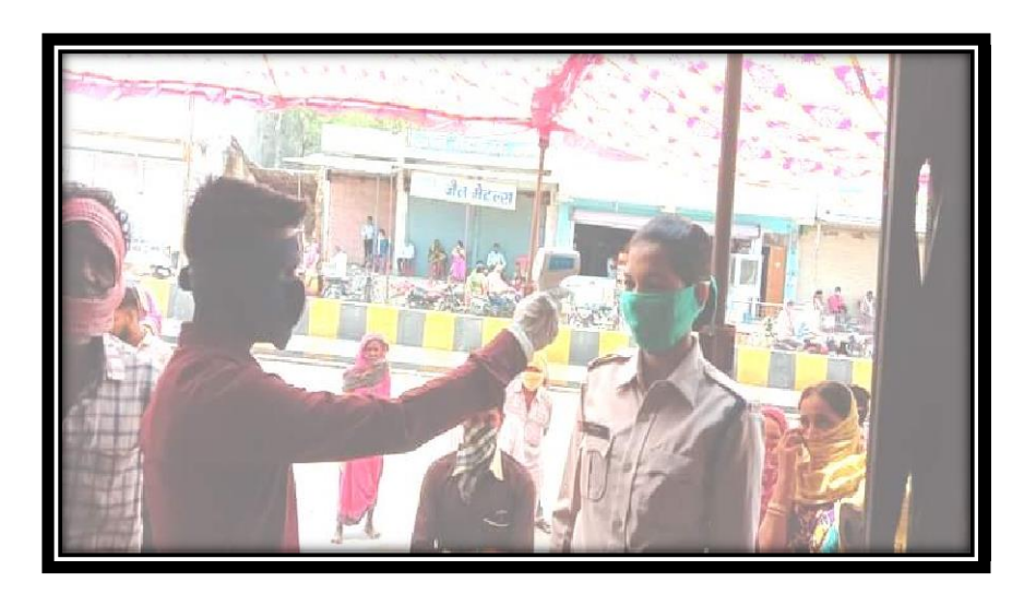
Covid Awareness Duty