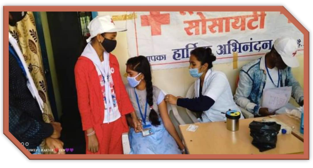
Vaccination Camp - 2021