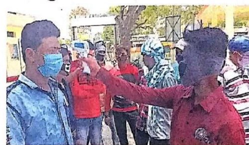
बागबाहरा। लोगों का तापमान मापते हुए स्वयंसेवक।

सोनकर ने कोविड-19 से संबंधित विभिन्न जानकारियां दी गई। ब्लॉक भीडभाड वाली जगहों में जाने से बचना चाहिए। एक दूसरे से हाथ नहीं मिलाना, खांसते या छींकते समय लगाना, अपने हाथों को हर 15- एवं प्राणायाम करने की बात कही।