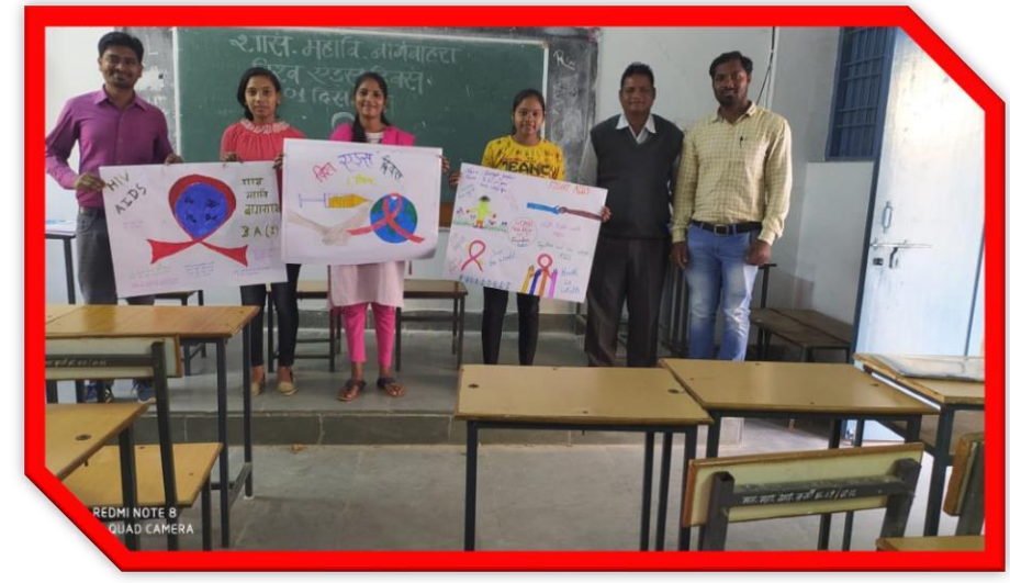
World Aids Day